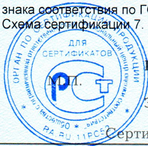
Схема сертификации 7.

Место нанесения знака соответствия – в товаросопроводительной документации, графическое изображение знака соответствия по ГОСТ Р 50460-92 с надписью «Добровольная сертификация».